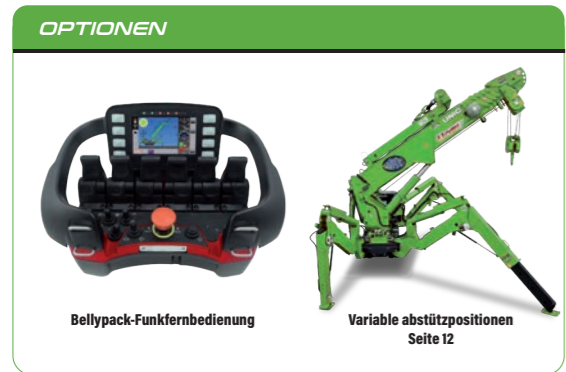
Bellypack-Funkfernbedienung Variable abstützpositionen Seite 12