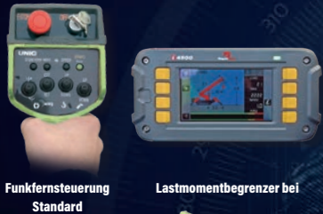
Funkfernsteuerung Standard Lastmomentbegrenzer bei Standard